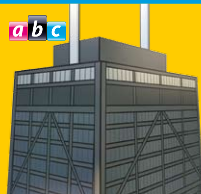
3D ILLUSTRACE IVO ZAJICEK

Stavba je tvořena jedním obřím komolým čtyřbokým hranolem, který slepíte z dílu 1. Shora hranol uzavřete střechem 2 a stavbu provlečte a upevněte na podstavce 3. Na střechem přilepte zpracovaný díl 4 a umístěte dva stožáry 5, 6. Posledním krokem je přilepení rubové části podstavce 7.